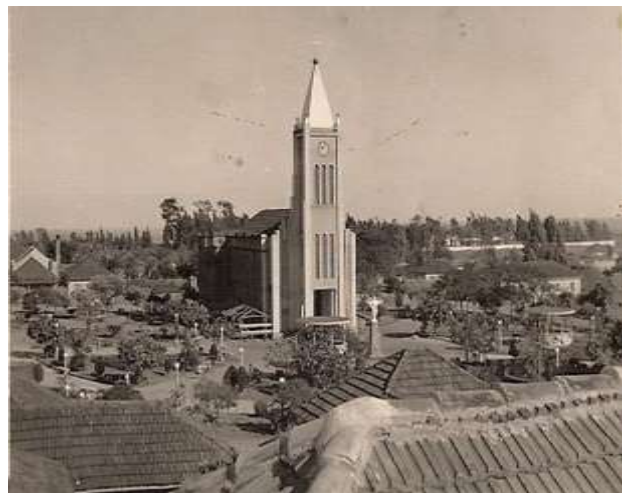
FIGURA 02: Echaporã na década de 30.

Em 1924, foi construída uma igreja e um cemitério a seis quilômetros do núcleo inicial, origem do povoado de Bela Vista, que cresceu devido à agricultura e pecuária. Seu rápido desenvolvimento fez com que o povoado se elevasse a categoria de distrito, substituindo Campos Novos como sede, e a município.