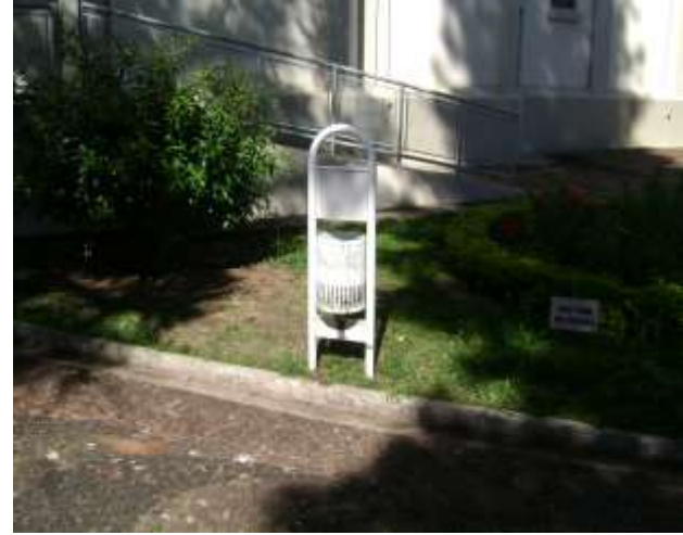
FIGURA 07: Lixeira disposta em Praça em Echaporã.