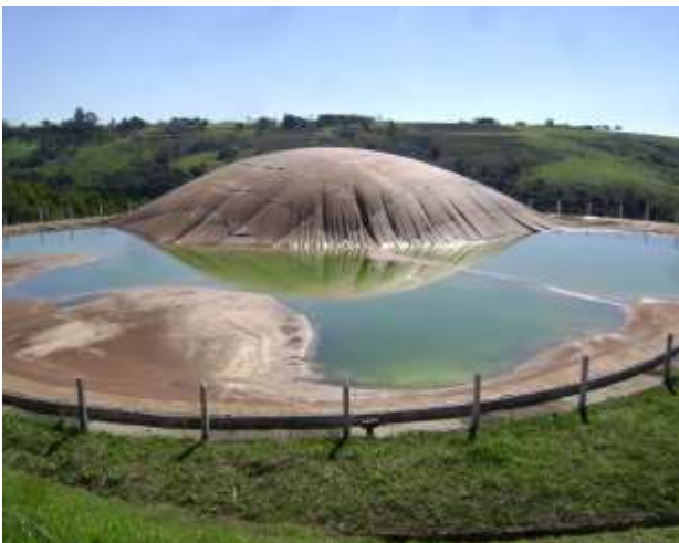
Figura 03: Lagoa aeróbica para tratamento de esgoto de Echaporã.

O município ainda não possui plano de saneamento básico conforme a lei 11.445 de 05 de janeiro de 2007, que abrange tratamento de água, tratamento de efluentes sanitários, macro drenagem urbana, e resíduos sólidos, este último em maneira mais aberta, tendo uma visão macro da geração e destinação destes.