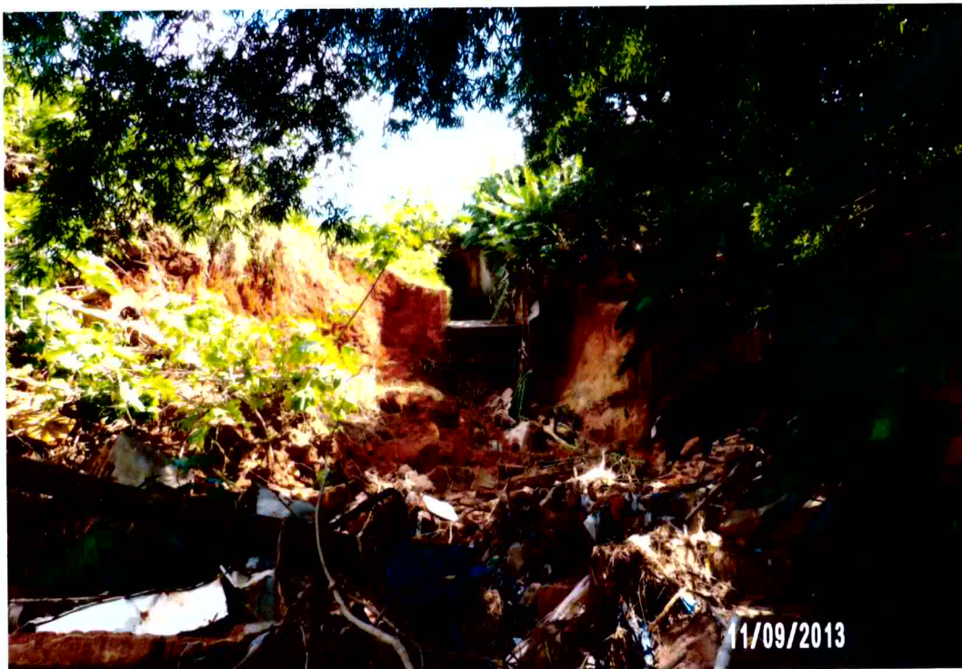
Vista do deslizamento do solo e da erosão causados pelas águas pluviais (foto 01)