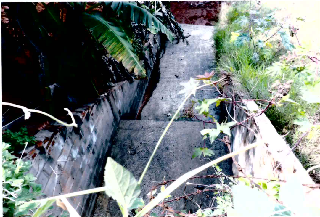
Vista da canaleta de drenagem que esta desabando junto com o deslizamento do solo (foto 04)