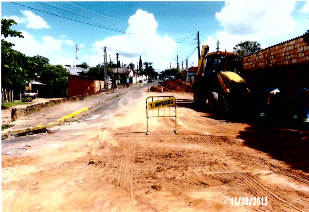
Vista da sinalização de trânsito impedido no local onde a galeria de águas pluviais de alvenaria que desabou a laje do fundo e a parede de tijolo maciço com sinalização (foto 12)