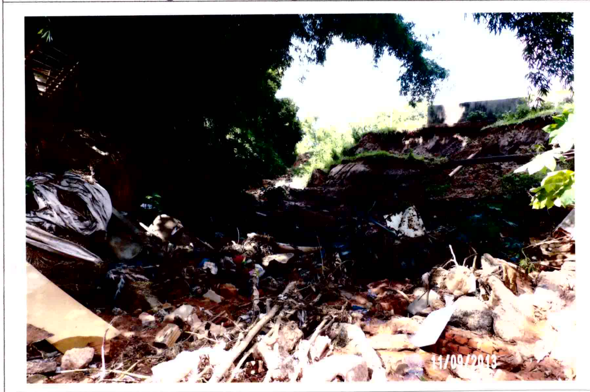
Vista do deslizamento do solo e da erosão causada pelas águas pluviais (foto 06)