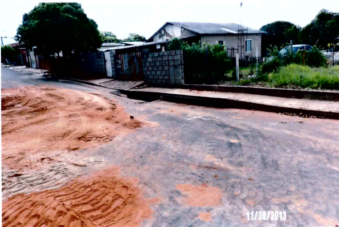
Vista da boca de lobo que capta parte das águas pluviais que estão causando o deslizamento e a erosão (foto 08)