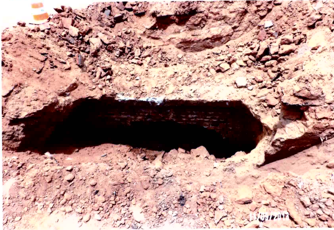
Vista da galeria de águas pluviais de alvenaria que desabou a laje do fundo e a parede de tijolos maciços na rua Mato Grosso (foto 09)