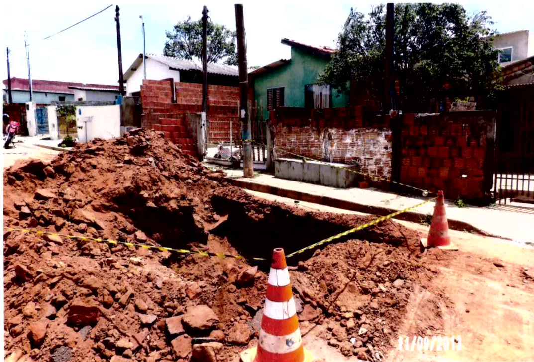
Vista da galeria de águas pluviais de alvenaria que desabou a laje do fundo e a parede de tijolos maciços na rua Mato Grosso (foto 10)