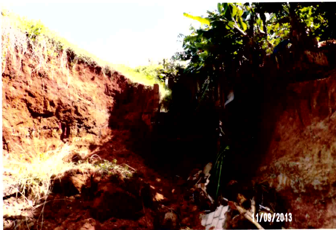
Vista do deslizamento do solo e da erosão causados pelas águas pluviais (foto 02)