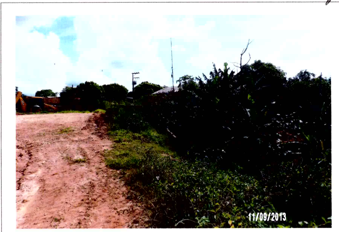
Vista do local da galeria com a sua proximidade da área urbana (foto 05)