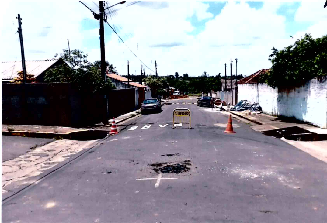
Vista da sinalização de trânsito impedido no local onde a galeria de águas pluviais de alvenaria que desabou a laje do fundo e a parede de tijolo maciço (foto 11)